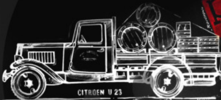
CITROËN U 23